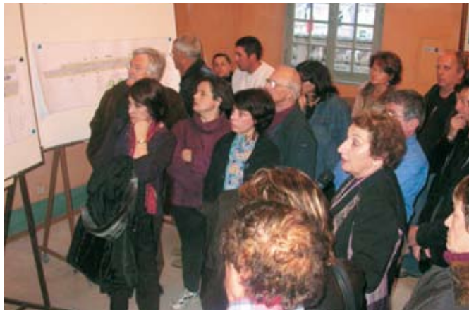
Chacun a pu donner son avis

L'avant projet de restructuration du boulevard Joffre a été présenté aux riverains, en réunion publique le 1 er mars dernier.