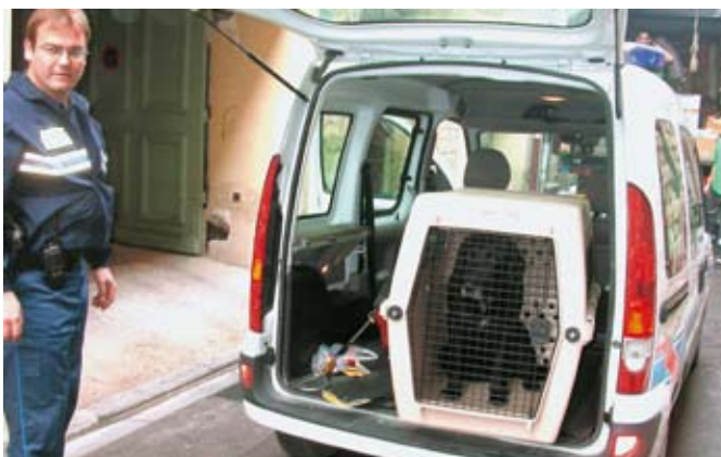
Un chien capturé rue Barbès

Adresse : Sacpa – Les Garrigues – 30 580 Vallerargues. Tél. 04 66 72 82 86.