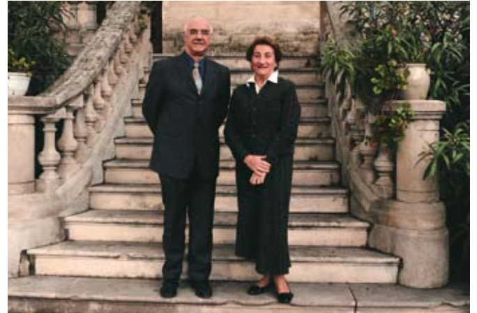
Beaucaire Tarascon, un rapprochement prometteur

Dans quelques années, c'est une certitude, les pages qui suivent seront au reflet de cette osmose naturelle qui régit le quotidien de nos administrés. Beaucaire et Tarascon sont trop proches dans leur géographie, dans leur esprit. Rendons-nous à l'évidence, pour le reste de la France, Beaucaire et Tarascon ne font qu'un.