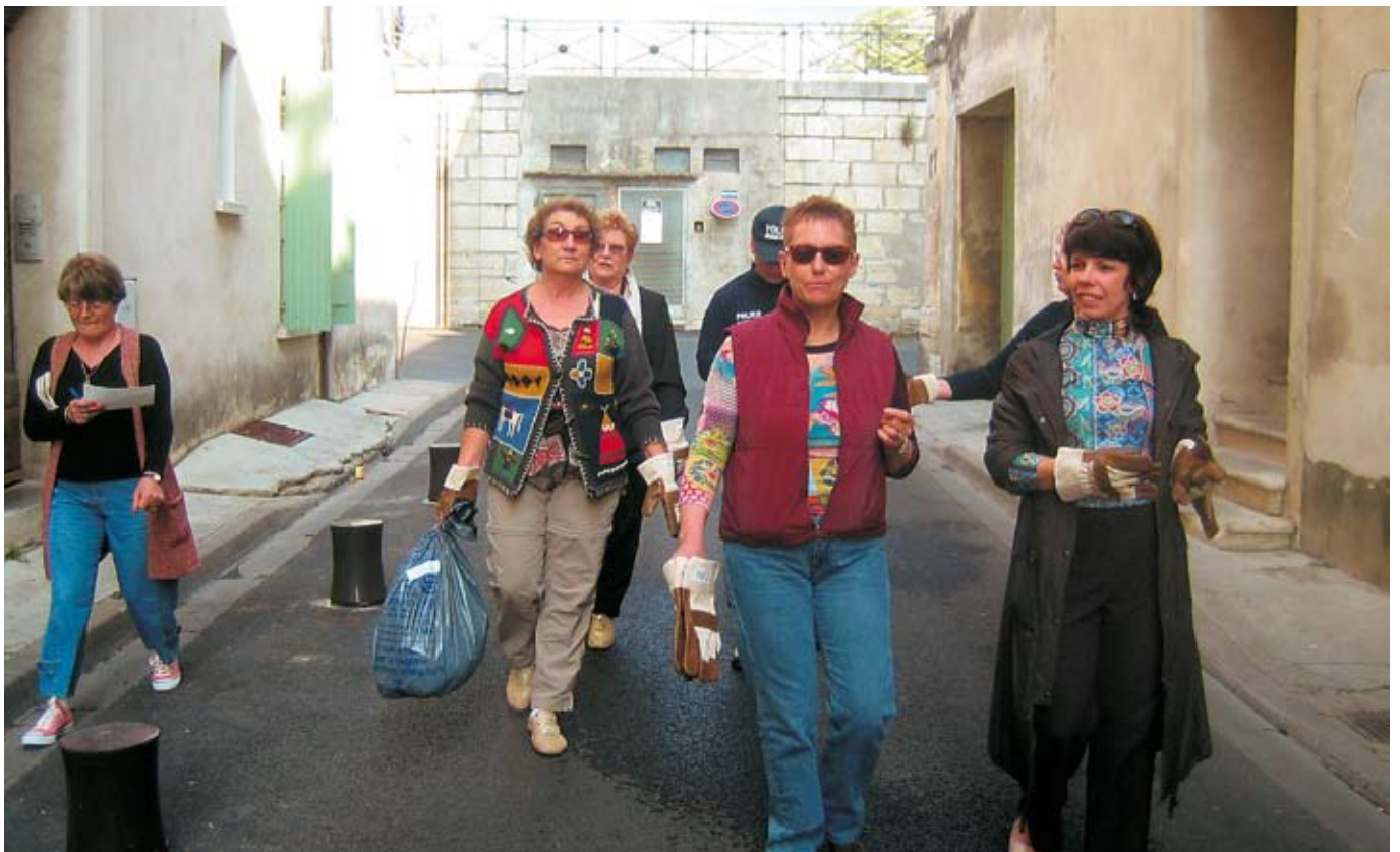
...et la collecte continue