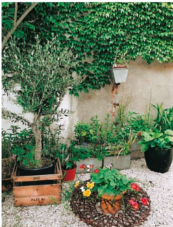
Des espaces fleuris au cœur de la ville

Ouvrez vos cours fleuries et faites partager votre passion pour la mise en valeur des fleurs et des pierres. C'est l'appel lancé par la toute nouvelle association Les Aires, aux propriétaires de ces lieux d'agrément, nombreux à travers la ville et dissimulés au regard du visiteur. En partenariat avec la ville de Beaucaire, l'association Les Aires projette en effet, d'organiser des visites guidées des cours fleuries.