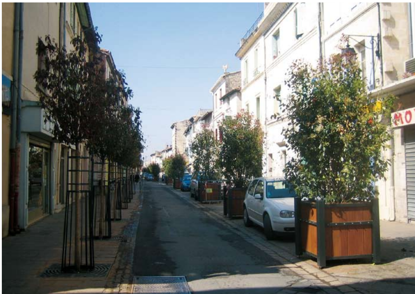
Un espace accueillant dans son décor végétal

La deuxième tranche qui suivra, portera sur un important programme d'animations : festival de la Rumba, braderie, jeu du rallye pédestre, fêtes de fin d'année... mais aussi sur la rénovation du boulevard Joffre notamment et l'aménagement du parking de la Gare, à proximité du rond-point des Fontêtes.