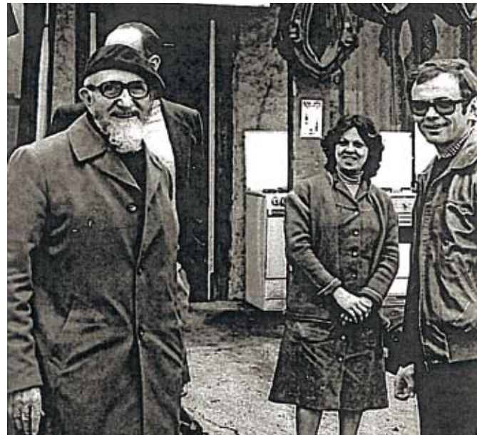
Les débuts de l'aventure beaucairoise