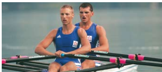
La concentration dans l'effort

A.H : C'est vrai. Beaucaire étant mon club d'origine, je suis d'autant plus fier des beaux résultats obtenus. Le club a remporté en 2006 un titre de champion de France et plusieurs médailles. Un de ses rameurs a même intégré l'équipe de France. Ce sont, je crois, les meilleurs résultats du club depuis sa création en 1984.