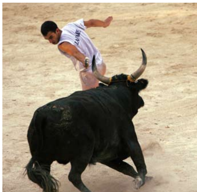
« Le geste auguste » du raseteur

Cette innovation répond aux aspirations de la Fédération Française de la Course Camarguaise qui préconise les courses aux As dans les grandes arènes. Compte tenu de ce nouveau calendrier, la Palme d'Argent a donc été abandonnée.