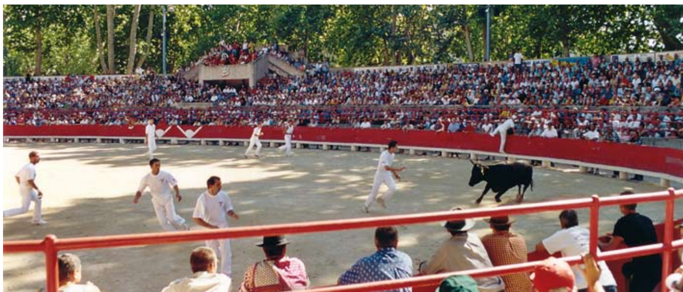
La piste de Beaucaire, vitrine de la course camarguaise