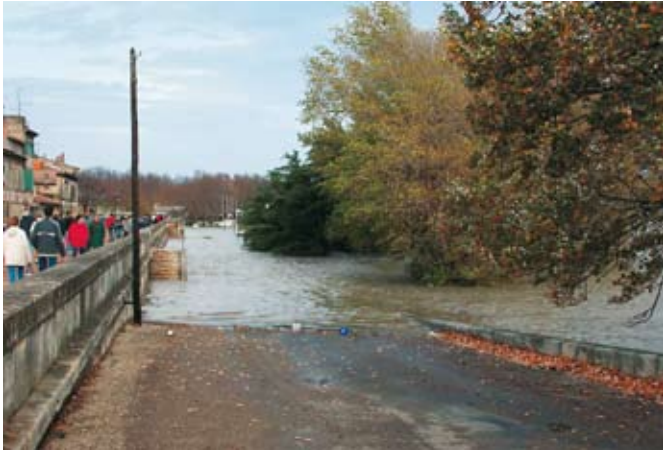
La Banquette construite en 1856

Présentées en février dernier, les conclusions tant attendues de l'audit mené par le cabinet d'expertise ISL sur la conformité des digues communales, sont rassurantes.