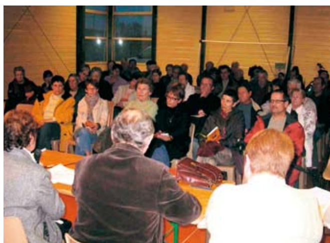
Les Beaucairois en nombre à chacune des réunions

C'est en mairie, dans une salle du conseil municipal bondée que s'est tenue cette troisième concertation citoyenne. Au programme les quartiers Saint Joseph et du centre ville. Dans ce secteur de la ville, de nombreux aménagements ont été réalisés depuis la précédente réunion, en octobre dernier. Quelques exemples : L'embellissement de la rue Nationale ; la pose anti-stationnement dans la rue du Château ; la remise de barrières de sécurité, rue Rouget de Lisle afin de protéger la sortie de l'école Nationale ; la condamnation d'accès à des immeu-