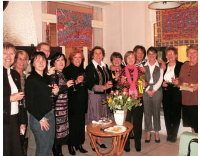
Les élues Beaucairoises autour du traditionnel verre de l'amitié

Parties pour la visite de l'abbaye de Saint Roman, ces dames se sont dit émerveillées par le site, avant d'apprécier un déjeuner bien mérité, au foyer restaurant de l'Age d'or.