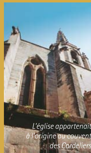
L'église appartenait à l'origine au couvent des Cordeliers

Depuis l'été dernier, la municipalité a engagé sur cet édifice des XIV e et XV e siècles, une première tranche de travaux, dans le cadre d'un programme de restauration, hors d'eau et hors d'air. Certains aménagements ont déjà été réalisés, comme la mise hors d'eau des terrasses les plus dégradées, situées notamment au-dessus de la sacristie, de la chapelle sud et de l'entrée rue Eugène Vigne. Tout récemment, un système de déshumidification concernant le sol et les murs, a été installé sur tout le niveau du rez-de-chaussée. Les vitraux de la façade sud et la rosace de l'entrée principale ont été restaurés. Une deuxième tranche pourrait ultérieurement concerner l'étanchéité de l'ensemble des toitures en pierre, dans la partie supérieure, ainsi que la restauration des vitraux du chœur et de la façade nord.