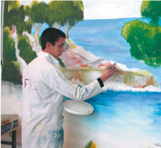
Une belle peinture murale en cours de finition

Créée en 1993, la SEGPA, section d'enseignement général et professionnel adapté, est destinée aux élèves de collèges pour un parcours personnalisé.