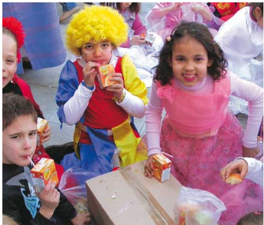
Le défilé... ça creuse !

E n ce grand jour, chacun rivalise d'imagination pour être la plus belle des princesses, le Zorro le plus authentique ou la sorcière la plus effrayante. Les enfants des écoles se sont rassemblés devant le Casino, avant de s'élancer sous un beau soleil, pour la grande parade aux côtés de la Bobomobile, du Circus Band et de la Gardounenque. Cette année, le défilé a fait une halte appréciée sur la place de la mairie pour un savoureux goûter offert par la municipalité. Après ce sympathique ravitaillement, les enfants reprenaient la direction du Casino où Carnaval devait être, sans pitié, livré aux flammes comme le veut la tradition. ■