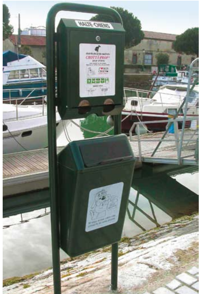
Distributeur de sacs hygiéniques sur les quais

Le non respect des espaces publics par les propriétaires de chiens, entraîne la facturation du ramassage des déjections pour un montant forfaitaire de 40 €. Par ailleurs, le dispositif de moyens vidéo sert aussi à la surveillance et à la prévention des infractions « environnementales ». ■