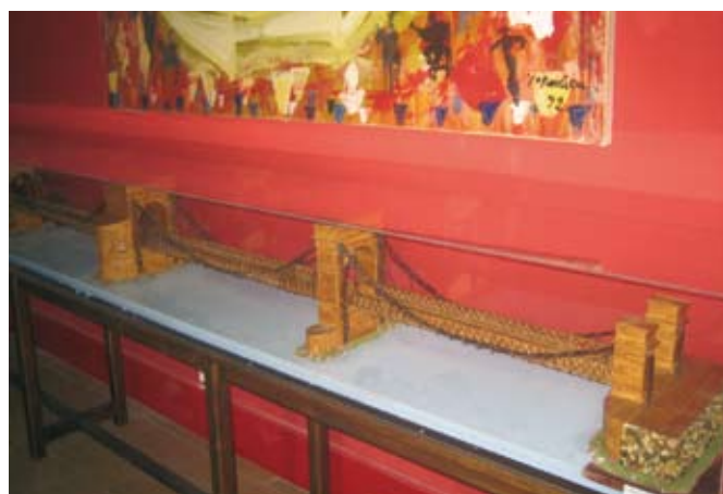
L'ouvrage était appelé « pont en fil de fer »

Chacun peut voir la maquette du pont, exposée dans le hall d'accueil de la mairie. ■