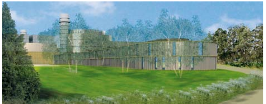
Esquisse du projet

La combustion de gaz fait tourner une première turbine générant de l'énergie électrique. Dans le même temps la chaleur des gaz d'échappement chauffe un circuit d'eau qui sous forme de vapeur fait tourner une deuxième turbine également génératrice d'énergie électrique. Par ce système combiné il est produit 40 % d'électricité en plus que ne l'aurait fait une simple turbine à gaz (pour la même consommation de gaz).