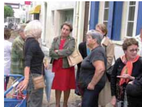
Rue Rouget de Lisle, le maire avec les riverains lors d'une visite de chantier.

Par suite de tracasseries administratives, les travaux d'assainissement ont pris un certain retard. Afin de prendre en compte les problèmes liés à l'accès de l'école Nationale, une interruption temporaire a été décidée. L'ouvrage devrait être terminé durant les vacances de Noël.