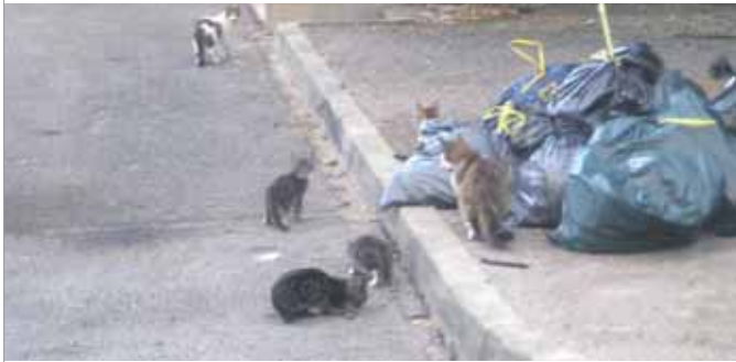
Les chats ont désormais disparu

Les animaux récupérés ont été remis au refuge de la Sacpa à Vallerargues.