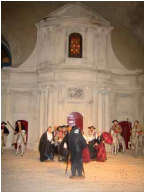
Le parvis de Notre Dame des Pommiers, une nouvelle scène des Santonales.

L'association Renaissance du Vieux Beaucaire présente une exposition exceptionnelle par l'espace qu'elle occupe, le sujet et la qualité du travail réalisé.