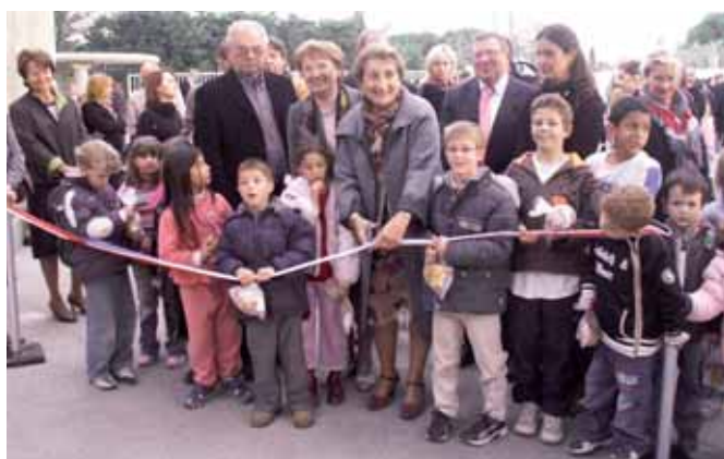
Chacun a voulu participer à l'inauguration

L'élue saluait également les entreprises Beaucairoises pour le travail réalisé sous le contrôle de l'architecte Yves Guiter.