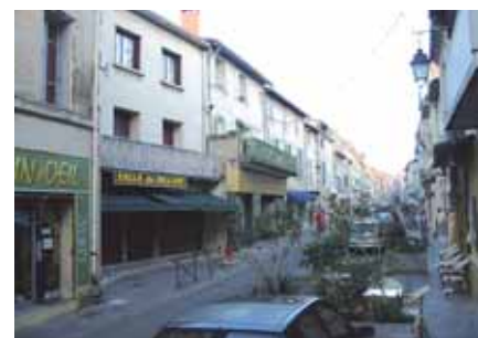
La rue aujourd'hui

Pour la belle saison, nous espérons que les Beaucairois pourront évoluer dans un nouvel environnement propice à la flânerie et au lèche-vitrines. ■