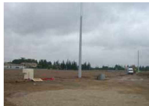
L'emplacement du futur stade

Les rugbymen devront faire preuve d'un peu de patience encore, avant de fouler la pelouse.