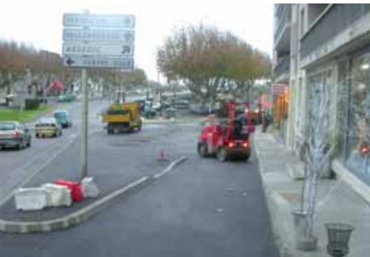
Les travaux quai de la Caravelle

Aménagement et mise en sécurité de la liaison entre le quai de la Liberté, le quai de l'Ecluse et l'accès au pont sur le Rhône. Rétrécissement des voies de circulation, création d'un parking « arrêt minute » pour les commerces et balisage du cheminement piéton.