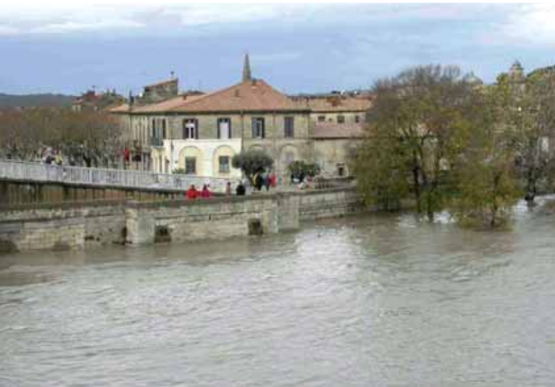
La Banquette lors des inondations de 2003

Lors du conseil municipal du 23 octobre dernier, une délibération a été votée à l'unanimité, portant sur la création d'une réserve communale de sécurité civile.