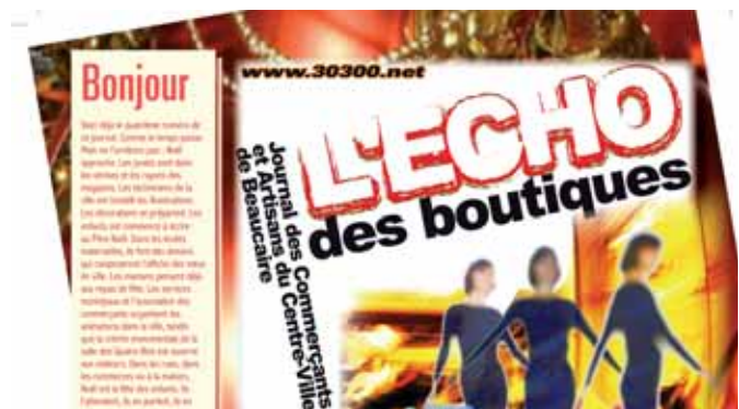
L'Echo des boutiques, journal trimestriel des commerçants du centre-ville

Ça bouge dans le centre-ville de Beaucaire depuis quelques mois, grâce à de multiples volontés.