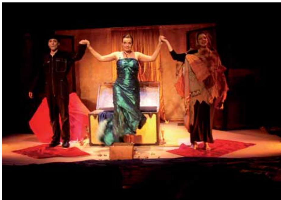
Cie de l'Echarpe blanche, "Le Trésor des Six Reines"

Quatre spectacles d'une qualité remarquable ont été donnés dans un lieu unique (Le Théâtre du Casino) aménagé durant toute la durée du festival en un espace d'accueil chaleureux et convivial, propice à la rencontre entre spectateurs et artistes.