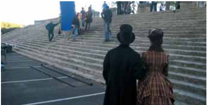
Silence on tourne

Après les architectes de l'école de Chaillot, le centre historique de Beaucaire séduit la télévision... anglaise.