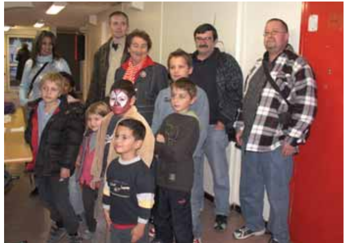
Les élus aux côtés du président du photo-club et des enfants.

La remise des prix devrait avoir lieu au mois de janvier et pourrait être couplée avec celle du concours des décorations de Noël. ■