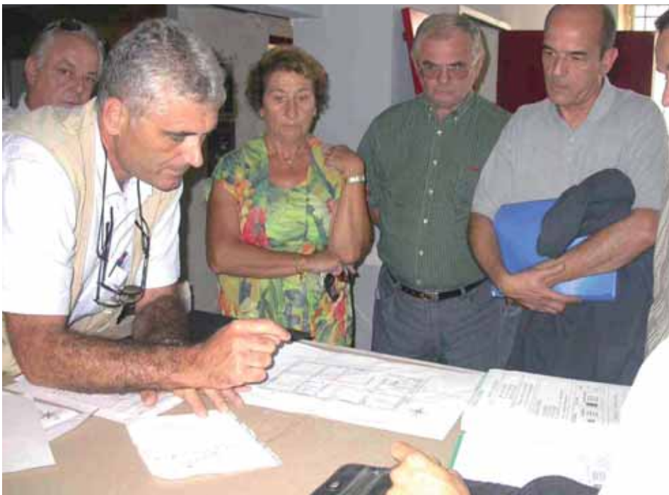
Une réunion de travail

Service Pénitentiaire Insertion et Probation Gard-Lozère (SPIP), conciliateur de justice, médiation pénale.