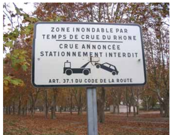
L'un des panneaux amovibles

Nous rappelons l'arrêté municipal n° 05 117 du 4 mai 2005 qui fixe la durée maximale de stationnement des véhicules, à 48 heures d'affilée sans mouvement.