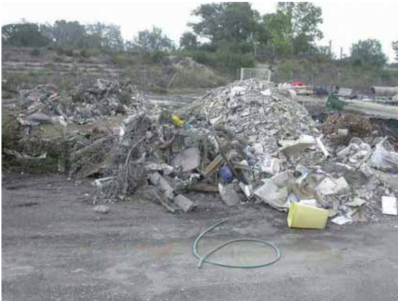
Le traitement des dépôts sauvages aura coûté aux contribuables, 40 000 €

L'accès du site est gratuit pour les particuliers et les artisans Beaucairois.