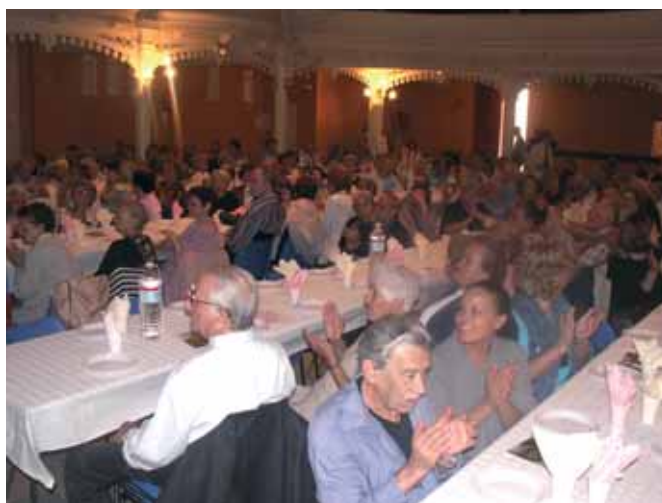
Toujours autant de monde pour le repas de clôture

Le maire, rappelait par ailleurs que l'action en faveur des an-