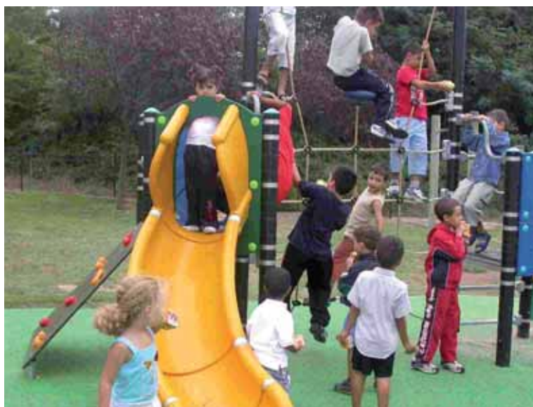
On grimpe, on glisse, on saute, chacun trouve son bonheur.

Les petits Beaucairois sont particulièrement gâtés. La mairie, à travers le service du Cadre de Vie a inauguré de nombreux aménagements au sein des jardins d'enfants en divers lieux de la ville.