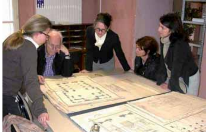
Un atelier de travail sous l'autorité d'un des professeurs