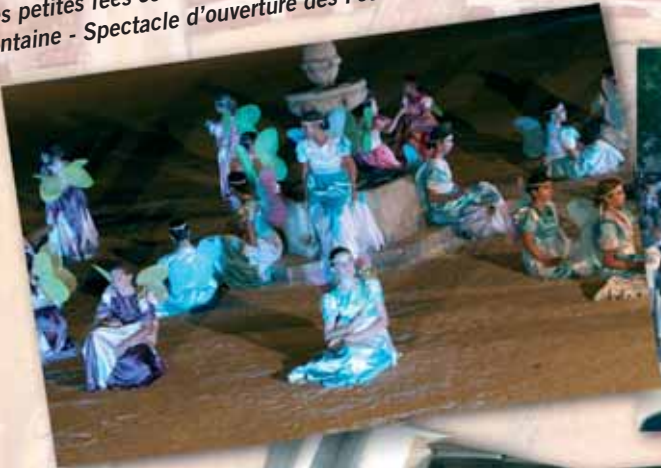
Les petites fées écoutent les histoires fantastiques autour de la fontaine - Spectacle d'ouverture des Fêtes de la Madeleine