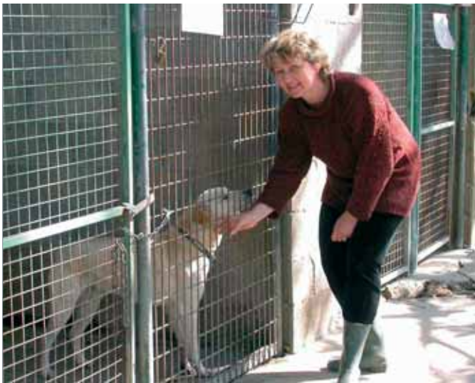
La caresse quotidienne

Pour info, la fabrication d'une tonne de papier recyclé, par rapport à celle d'une tonne de papier bois permet d'économiser 3 tonnes de bois, 20 000 litres d'eau et 1 000 litres d'équivalent pétrole. Le papier peut être recyclé jusqu'à 10 fois.