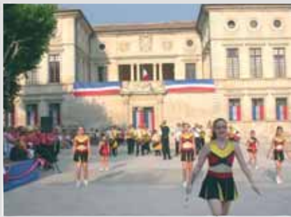
Pas de fête sans majorettes