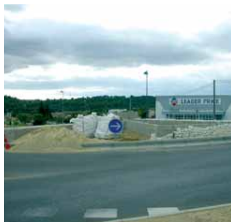
Rond Point Leader Price