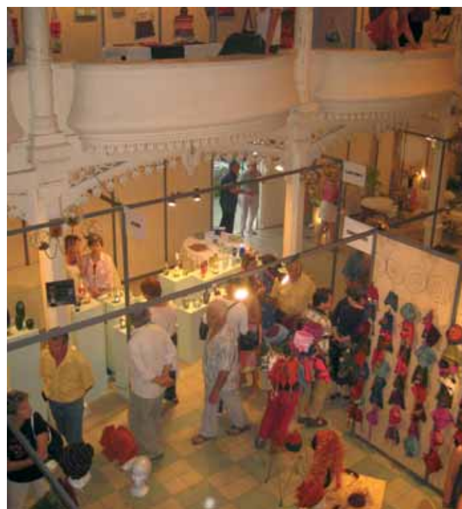
Les 29 artisans d'Art au Casino