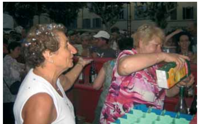
Mme le maire et les élus ont assuré le service

un lieu de rencontres, un espace de convivialité. Cette place au cœur de la ville prendra place au cœur de la vie de mes concitoyens ». ■