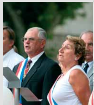
Moment d'émotion lors de l'hymne national