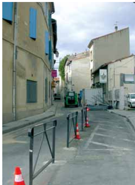
Rue Rouget de Lisle