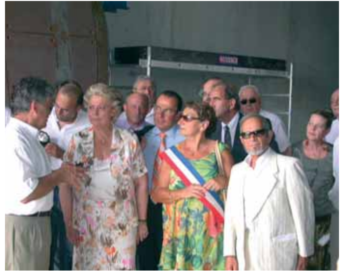
Visite de l'Unité Ecoval 30

250 kg finissent en décharges ou soient incinérés et que dans dix ans, la quantité soit réduite à 200 kg ».