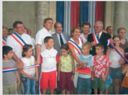
Sympathique inauguration avec la traditionnelle coupe du ruban