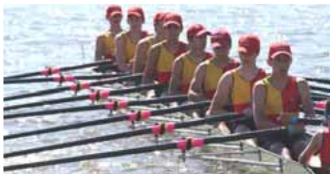
Le 8 minimes garçons

Avec ses 200 licenciés, l'Aviron Club Beaucairois en constante progression depuis quatre ans, affiche avec fierté un excellent palmarès.