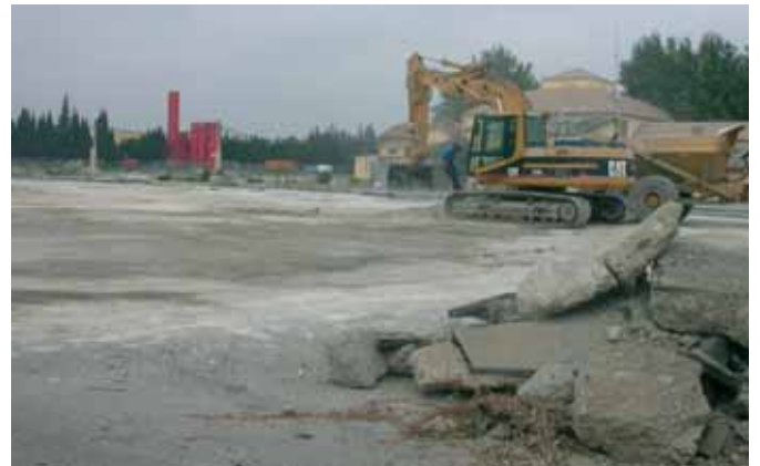
L'entrée du site

Malgré toutes les précautions prises, brumisation pendant les travaux (réduction des envois de poussières) et pose d'une bâche contenant du charbon actif durant les arrêts d'excavation (nuit et week-end), des odeurs peuvent être occasionnées, précise l'entreprise Séché Eco services, en charge des travaux.