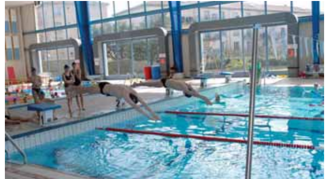
C'est reparti pour une nouvelle saison

L'Aqua-Gym fonctionne les mardis et jeudis de 18h 15 à 21h 30, et le samedi de 11h à 12h 30.