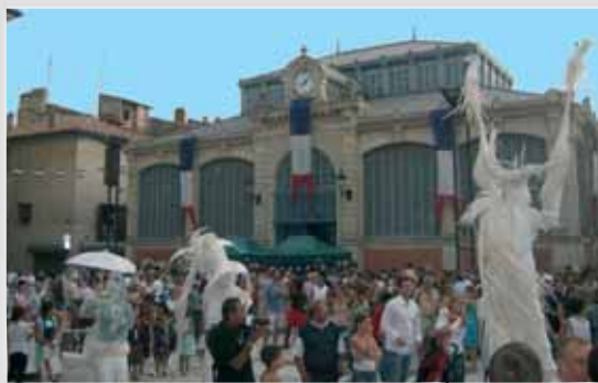
Des Beaucairois venus en nombre découvrir le nouveau cœur de ville