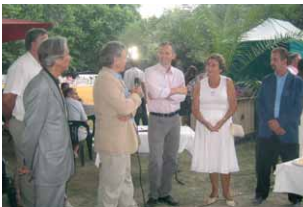
La cérémonie de signature

Compte tenu du beau succès remporté pour la 4 e année consécutive par les Rencontres Equestres Méditerranéennes, un protocole d'accord a été conclu sur les lieux mêmes de la manifestation, le parc de Saint Félix, entre les éleveurs et la ville de Beaucaire.