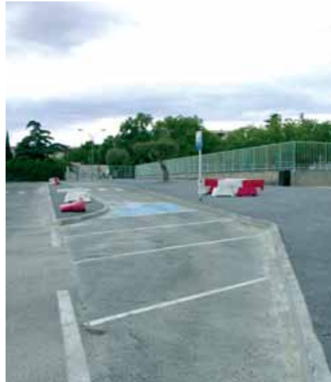
Quartier Puech Cabrier