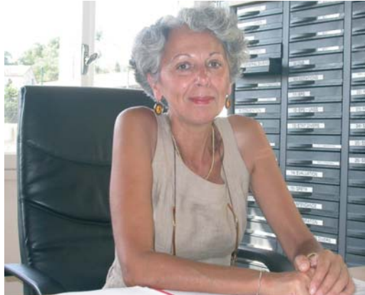
M me le Principal prend possession de son bureau

C'est pour lui une responsabilité pleine et entière, il était jusqu'alors, Proviseur adjoint à Narbonne.