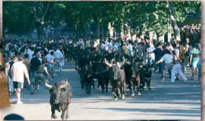
1, 2, 3, 4, 5... 100 chevaux et 100 taureaux