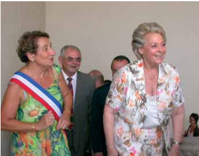
Arrivée à l'Hôtel de Ville

« Ce centre est un outil très précieux pour atteindre nos objectifs en matière de gestion des déchets, soulignait la ministre. Aujourd'hui, chaque Français produit en moyenne 360 kg de déchets par an. Le but est que dans cinq ans, seuls