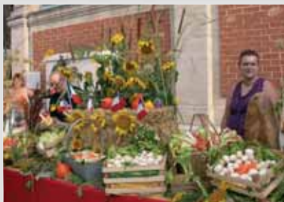
Le magnifique étal de fruits et légumes de la Garriguette