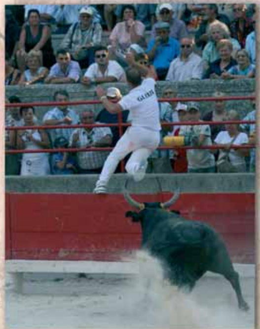
Saut d'Alexandre Gleize, vainqueur de la Palme d'Or 2006