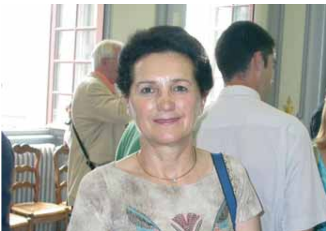
Madame le maire de Beaucaire

Elle s'est également félicitée de « la très bonne organisation et de la qualité des débats engagés ». ■