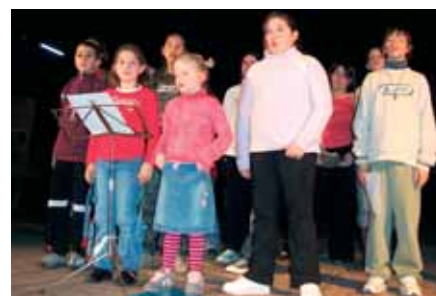
La classe de chant

avaient inscrit à leur programme une nouveauté. L'idée était d'accompagner musicalement la projection de films muets proposée par le ciné-club de Beaucaire. La prestation fut très appréciée.