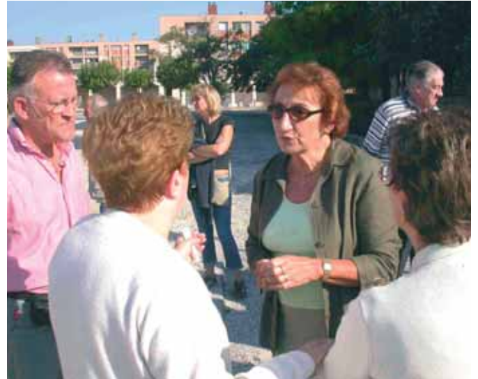
La population toujours bien présente

Lundi 9 octobre 17h30, quartier Sud du Canal et Plaisanciers du port, RDV : devant le centre médico-social, chemin Saint Joseph.