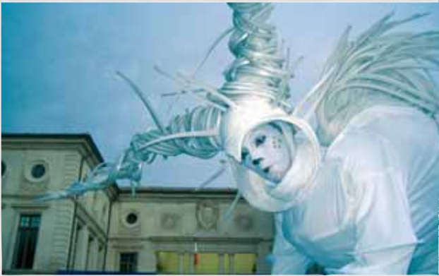
Les étranges et poétiques personnages semblent planer sur la place