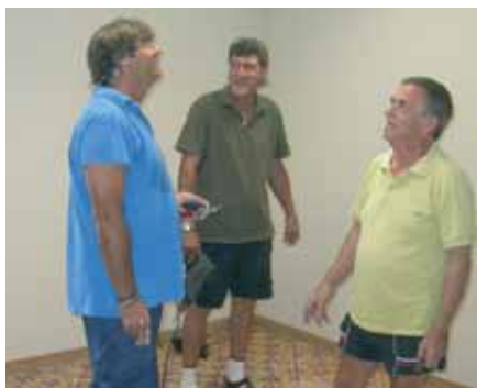
Du cœur à l'ouvrage

Murs retapés et repeints, sols et plafonds entièrement refaits, réseau électrique