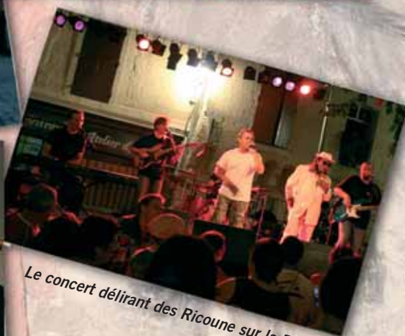
Le concert délirant des Ricoune sur la Place Vieille