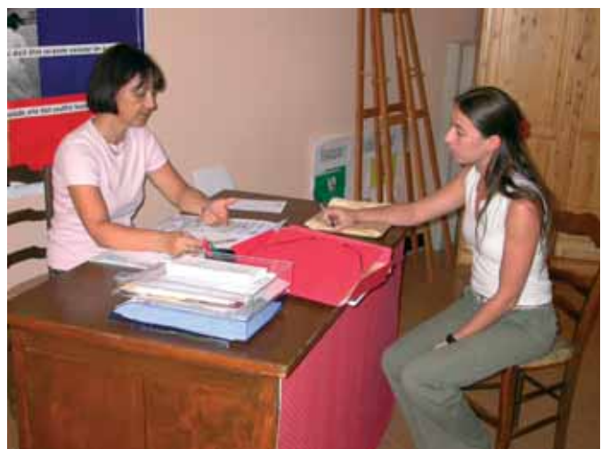
La permanence du lundi après-midi

Présente dans toute la France à travers plus de 100 associations départementales en France métropolitaine et dans les DOM-TOM, l'Association France Alzheimer, est la seule association reconnue d'utilité publique dans le domaine de la maladie d'Alzheimer ; elle compte 90 000 adhérents et donateurs.