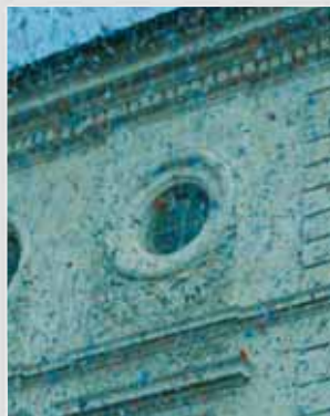
L'Hôtel de Ville sous une pluie de confettis