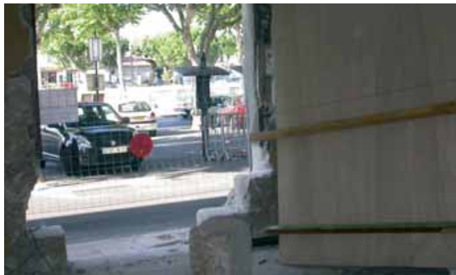
La future entrée, côté cours Gambetta

Chaque section, jeunes et adultes, sera totalement indépendante et une salle d'étude pour l'accueil des collégiens sera