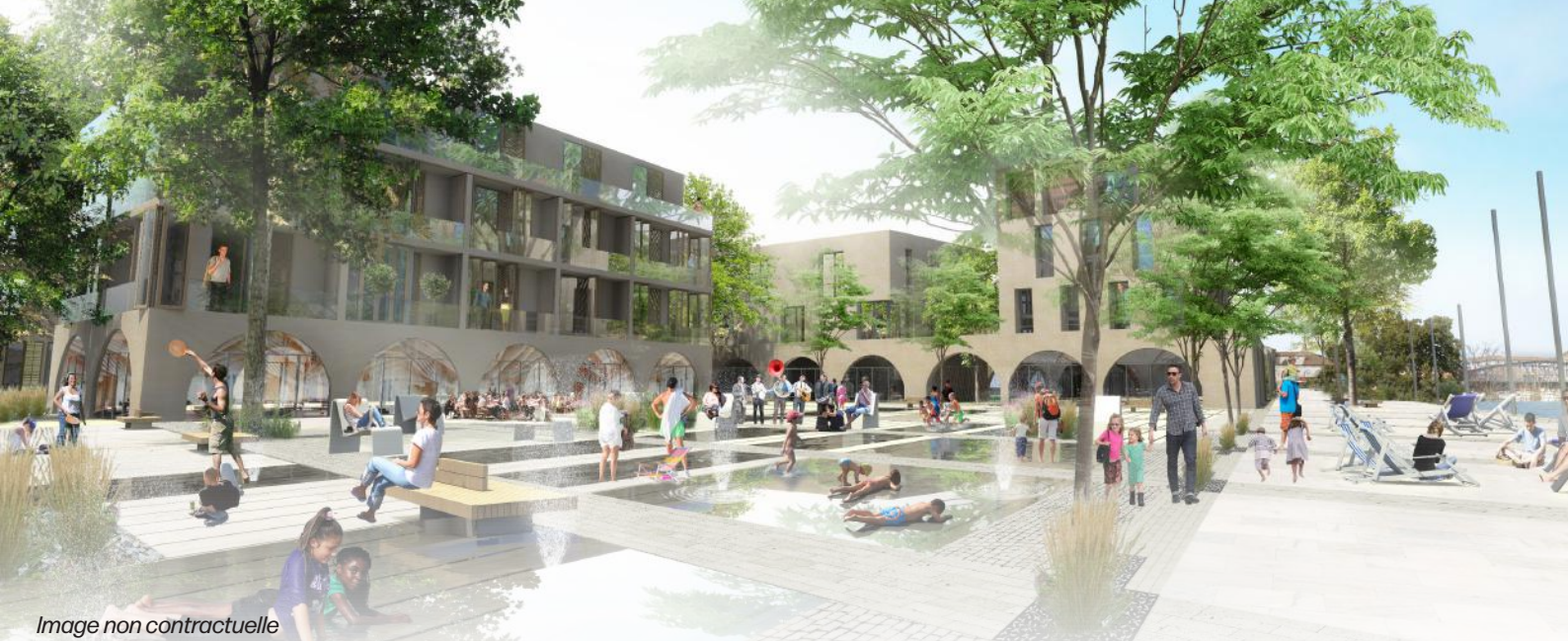
Image non contractuelle