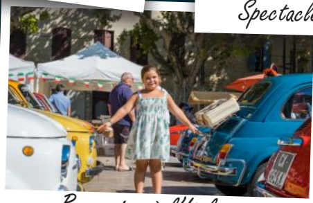
Beaucaire à l'Italienne