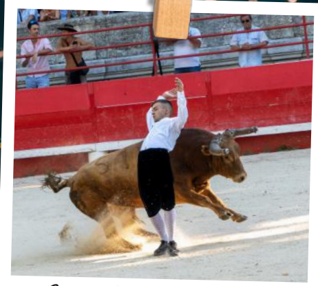
Spectacle des Recortadores