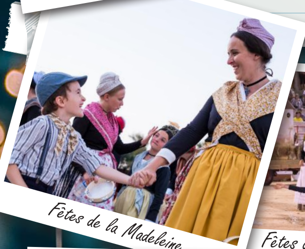
Fêtes de la Madeleine