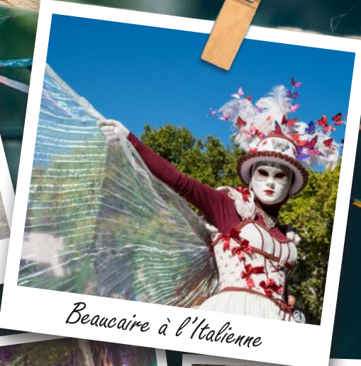
Beaucaire à l'Italienne