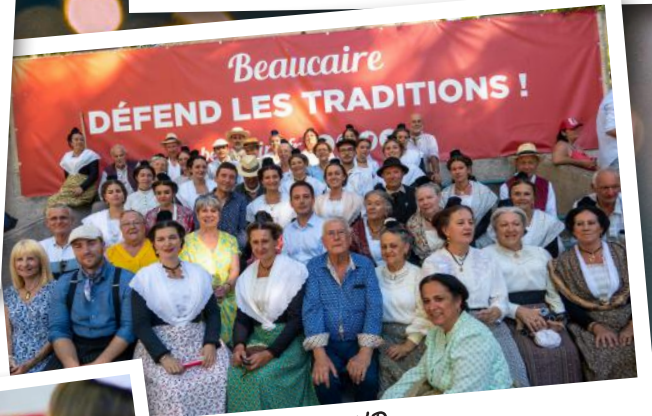
D. V. d'Or