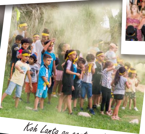
Koh Lanta au centre aéré