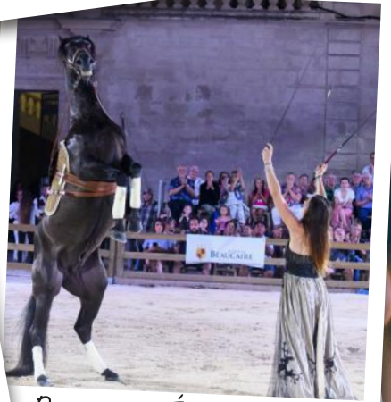
Rencontres Équestres 2022