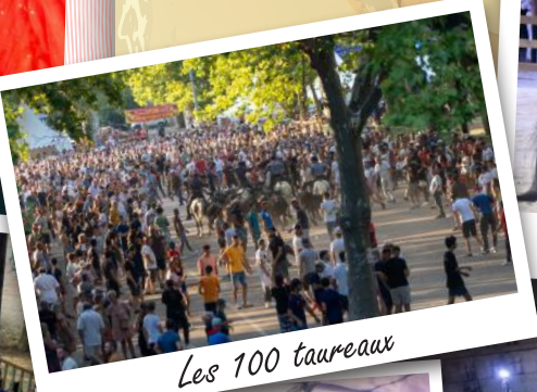
Les 100 taureaux