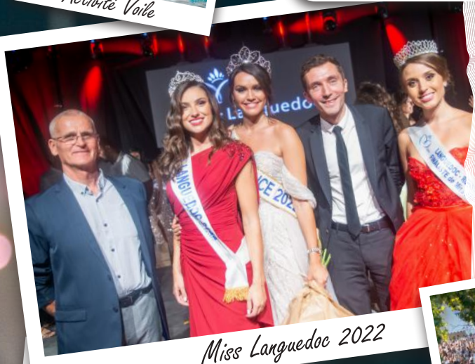
Miss Languedoc 2022