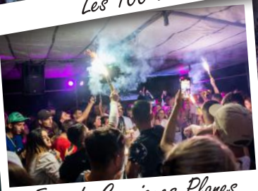
Fête de Garrigues-Planes