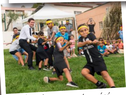
Koh Lanta au centre aéré