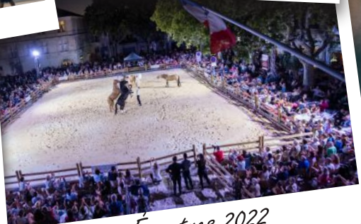
Rencontres Équestres 2022