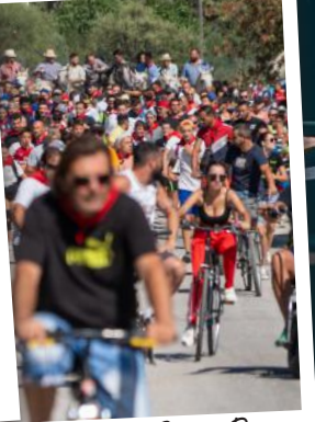
Abrivado de Saint-Roman