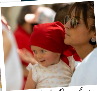
Abrivado de Pampelune