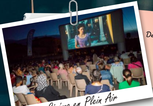
Cinéma en Plein Air