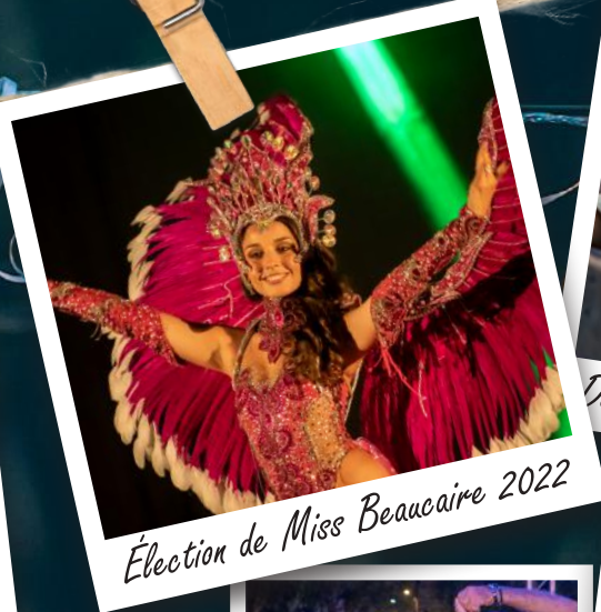
Élection de Miss Beaucaire 2022