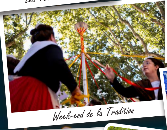
Week-end de la Tradition