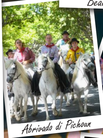
Abrivado di Pichoun