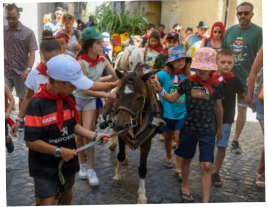
Abrivado di Pichoun