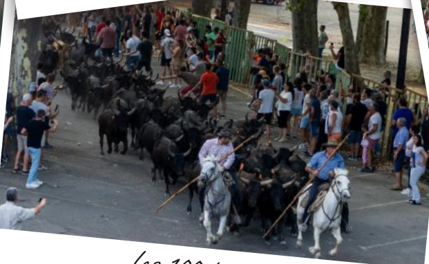
Les 100 taureaux