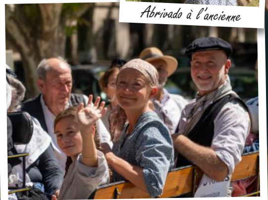
Abrivado à l'ancienne