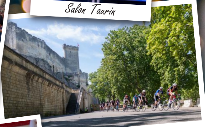
La Ronde des Près