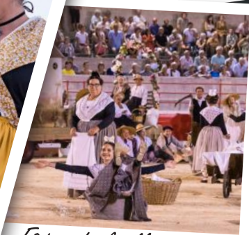
Fêtes de la Madeleine