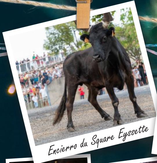
Encierro du Square Eyssette