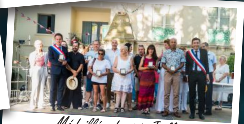
Médailles du 14 Juillet