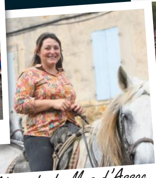
Abrivado du Mas d'Assac