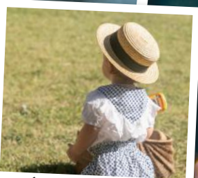
Abrivado à l'ancienne