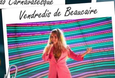
Vendredis de Beaucaire