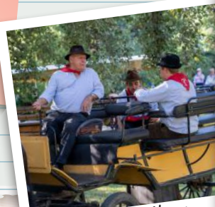
Abrivado à l'ancienne