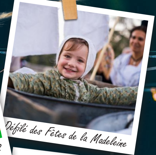
Défilé des Fêtes de la Madeleine