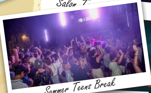
Summer Teens Break