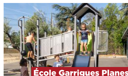
École Garrigues Planes