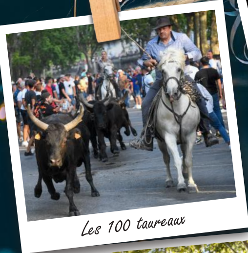
Les 100 taureaux