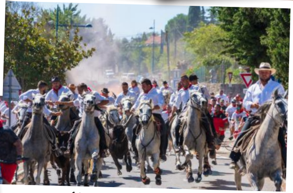
Abrivado de Pampelune