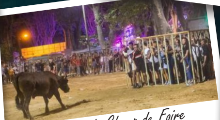
Encierro du Champ de Foire