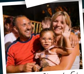
Encierro du Champ de Foire